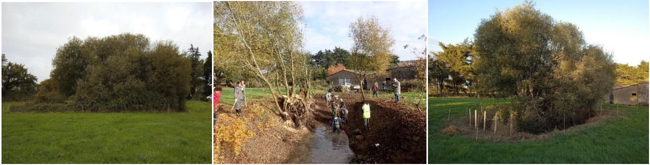
Restauration d'une mare embroussaillée sur une ferme (de g. à d. : avant, pendant, après chantier).