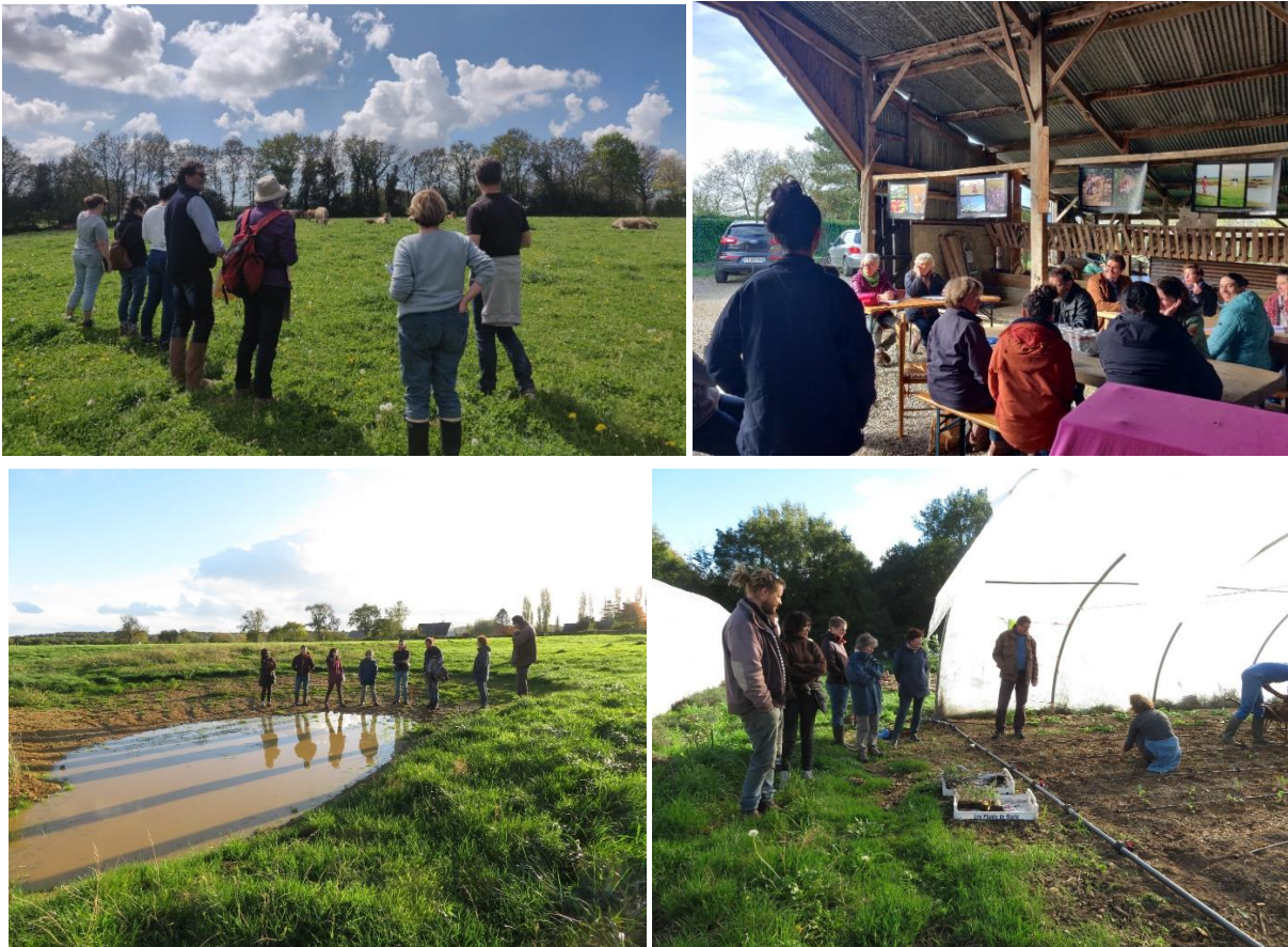
Figure 3 : en haut : Formation DPN du 13/04/22 à la Ferme du Grand Bois, Martinet. Parties "terrain" et "théorie"; en bas : Visite de ferme à occasion d'une formation au DPN sur une ferme sarthoise en 2022